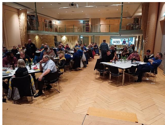
Gemütlicher Ausklang nach der Metzgete