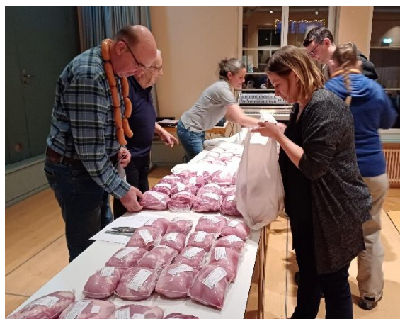
Gemütliches Absenden mit Fleischgaben